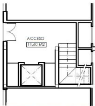
PLANTA BAJA REFORMADA (SUPERFICIES)